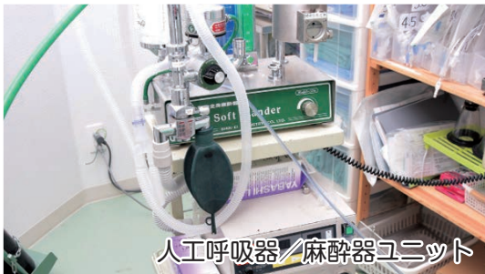
人工呼吸器/麻酔器ユニット