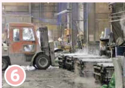
6 シートを被せて、早く固まるよう蒸気を当てる