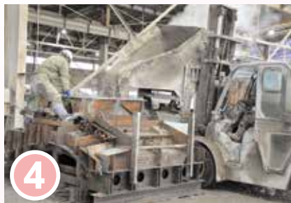
4 コンクリートを投入する