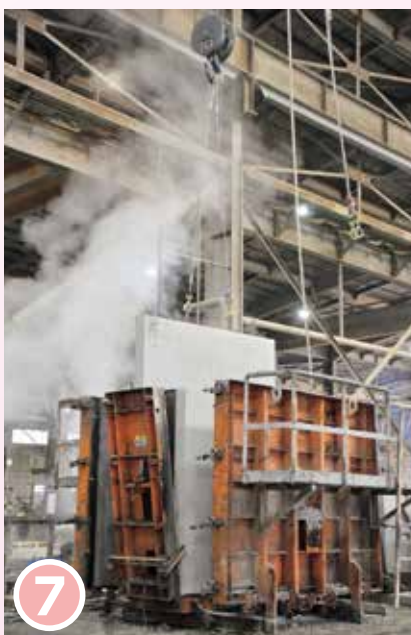
7 固まったら型枠を解体して、製品を脱型する