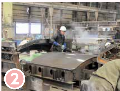
2 型枠にハクリ剤を散布する