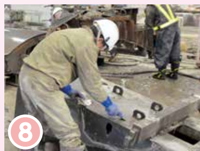
8 型枠に残ったコンクリート片を除去