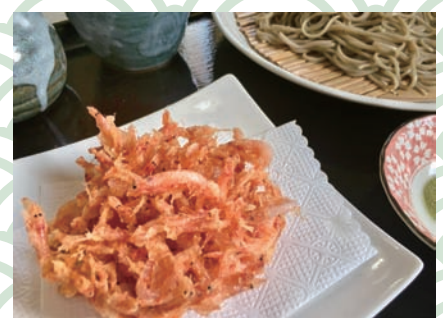
桜えびのかき揚げ蕎麦