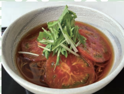
完熟とまとの冷やかけ蕎麦