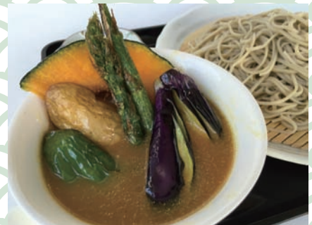
夏野菜のカレーせいろ